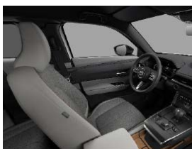
Modern Confidence áklæði í Advantage og Makoto útfærslu