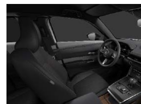
Urban Expression áklæði í Makoto útfærslu