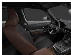
Industrial Vintage áklæði í Advantage og Makoto útfærslu